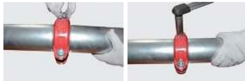
Рис.3. Грувлочное соединение жесткой муфтой.