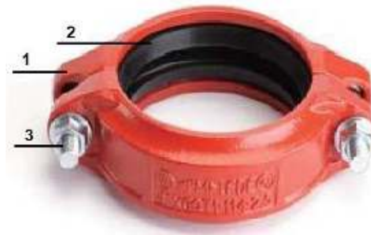
Рис.2. Жесткая муфта «LEDE».